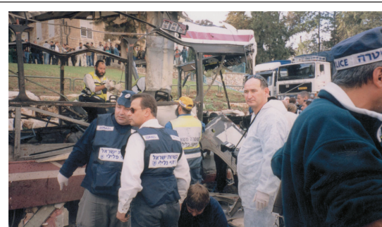
Vom 29. September 2000 bis zum 14. März 2005 wurden durch den arabischen Terrorismus 1'047 Israelis ermordet und 7'134 verletzt.

Die Wahl von Abu Mazen (alias Mahmud Abbas) zum Präsidenten der palästinensischen Autonomiebehörde überrascht kaum angesichts des Fehlens anderer Kandidaten, die über eine ähnliche Finanzkraft verfügten wie er als Kandidat der Fatah, und zwar in seiner Eigenschaft als Vizepräsident der Fatah und als